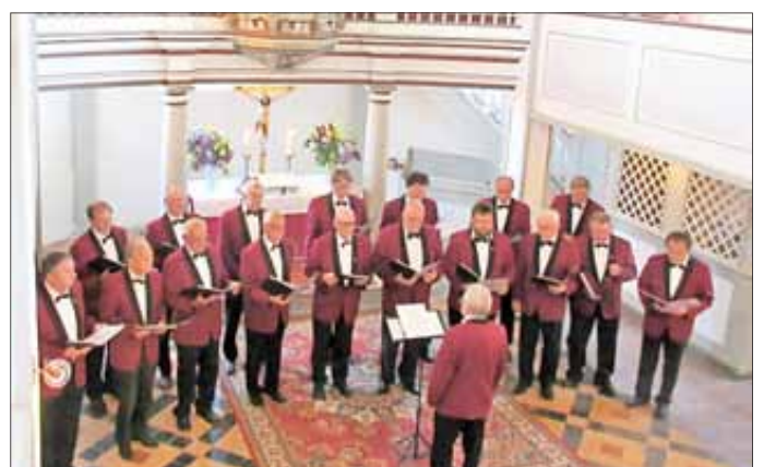
Auftritt in Ballstädt

Die Singstunden nach der Sommerpause beginnen am Freitag dem 31. August 20.00 Uhr im Vereinsraum des Goldenen Widder. Hierzu sind nicht nur alle aktiven Sänger des Chores eingeladen, sondern stets auch sangesfreudige Herren jeden Alters aus Witterda und Umgebung herzlich willkommen.