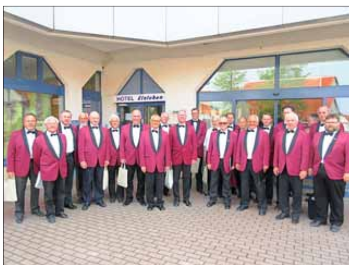
Vor dem Geburtstagsständchen in Elxleben

Für das passende Ambiente hatte der Kirmesverein den gesamten Platz eingezäunt und dekoriert. Ganz traditionell feierte Elxleben dann am Samstag bei hochsommerlichen Temperaturen. Es herrschte reges Treiben auf den Grünflächen.