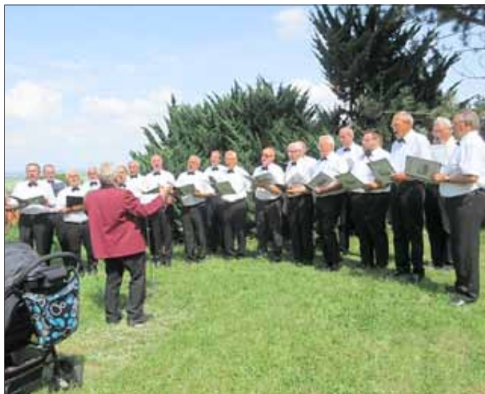
Gemeindefest St. Martin