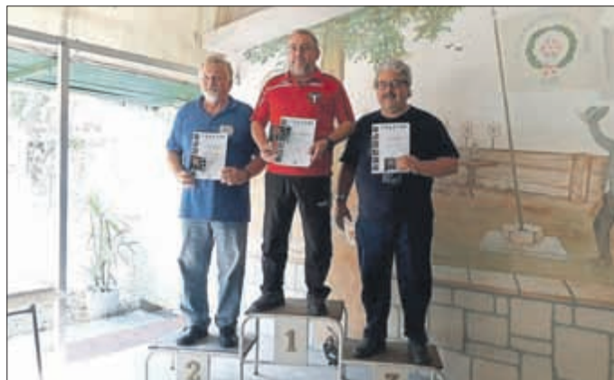
siehe Bild 5