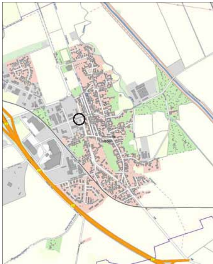
Lage des Plangebietes im Ort

Dieser Beschluss wird gem. § 2 (1) BauGB hiermit bekannt gemacht. Die Lage des Plangebietes in der Ortslage sowie die Grenze des räumlichen Geltungsbereiches sind aus den mitveröffentlichten Übersichtsplänen ersichtlich.