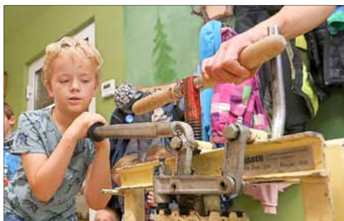
Kinder an der Apfelpresse