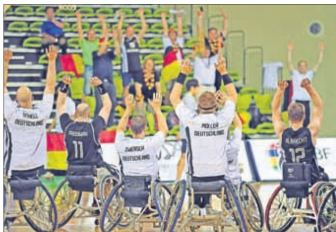
Das deutsche Team feiert die kleine deutsche Fankolonie, die die 9.000 Kilometer lange Reise nach Korea auf sich genommen hat.

Türkei: Özgür Gürbulak (23/4 Dreier), Fikri Gündogdu (8), Cem Gezinci (6), Ferit Gümüs (6), Murat Arslanoglu (5), Deniz Acar (2), Ismail Ar (2), Bestami Boz, Kaan Dalai (n.e.), Ibrahim Yavuz (n.e.), Murat Yazici (n.e.).