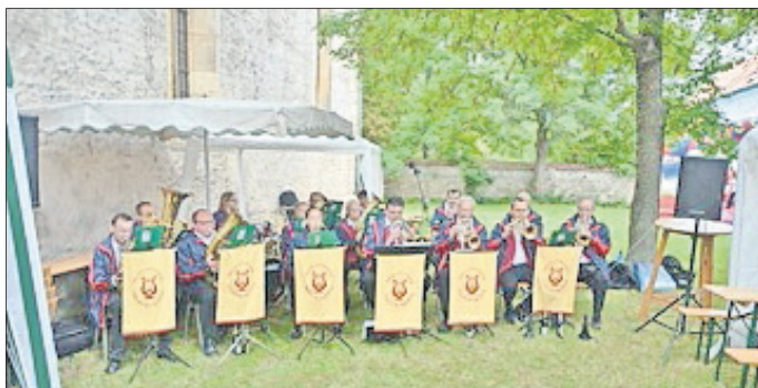
Die Körnbachtaler Blasmusikanten, Elgersburg/Ilmenau bei vollem Atem.