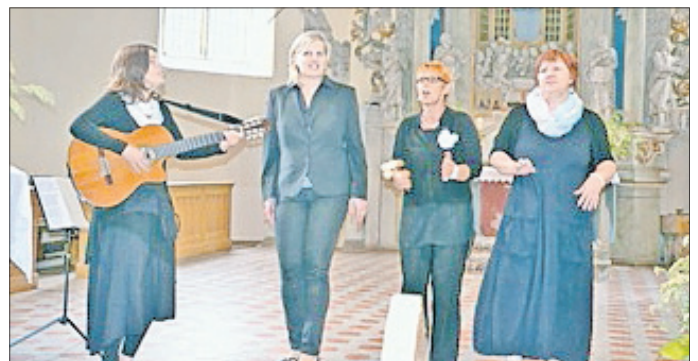
Vier Damen aus Erfurt. A-Capella Gesang der Fresh Female Voices.