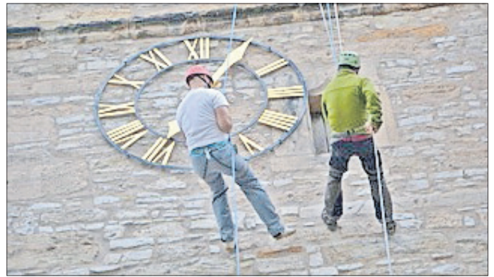
Mutige am Seil. Links der Begleiter; rechts der zu Sichernde.