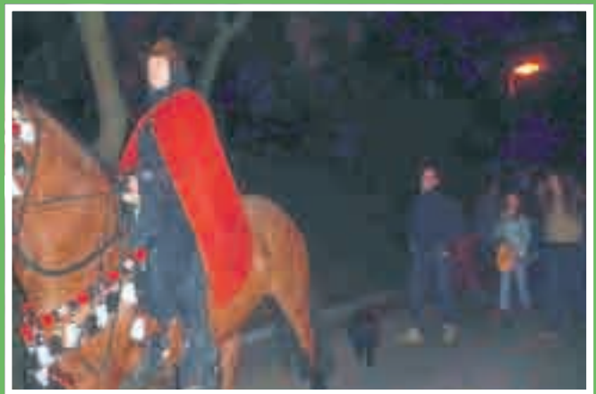
Der heilige Martin zu Pferd