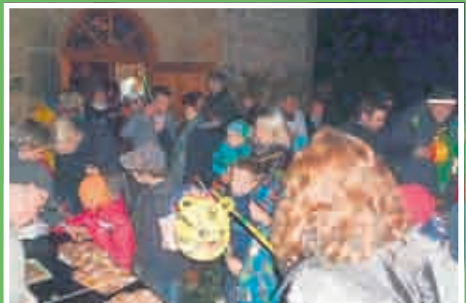
Das Teilen der Martinshörnchen vor der Kapelle - „gesponsert“ vom Pferdesportverein Witterda e.V.