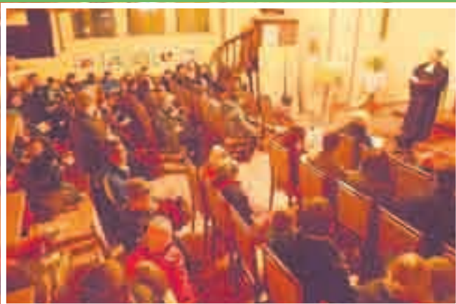
Martinssegnen in der Gustav Adolf Kapelle