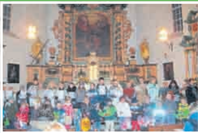
Martinsfeier in der Kirche „Sankt Martin“